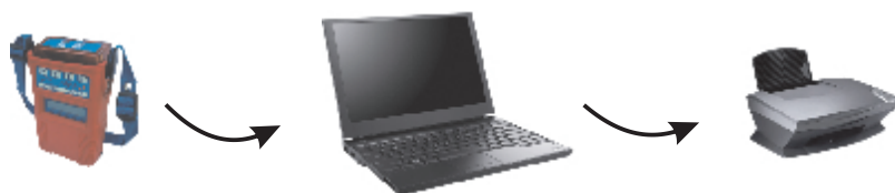
Saída de comunicação